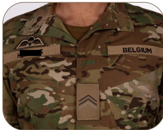
Field shirt kan gesloten worden maar nooit voor tenue 4E/4F/4G.