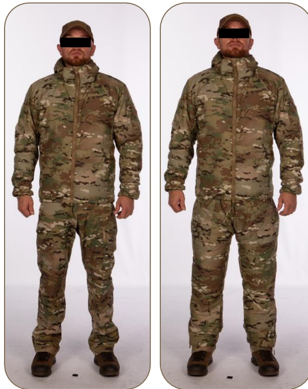
High Loft Jacket (& Regenkleedij), kentekens/insignes: Zone V3: Patch Belgium, Graad/Grade en Nom/naam (rear view). Zone V2: Kenteken/insigne eenheid/ unité.